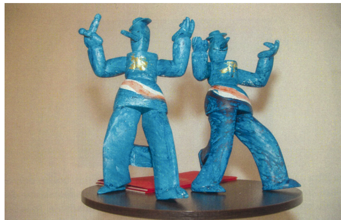
Statua „Šokac“ – rad akademika Zlatka Boureka, odlijevak Ljevaonice Ujević